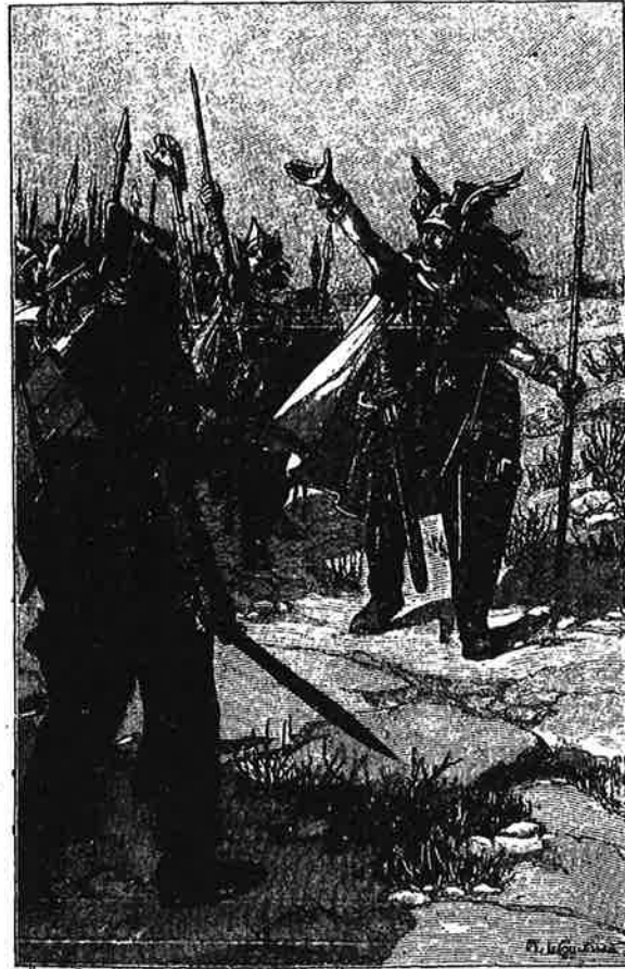
VERCINGETORIX ENCOURAGE LES GAULOIS A COMBATTRE LES ROMAINS ET A LES CHASSER DE LA GAULE.