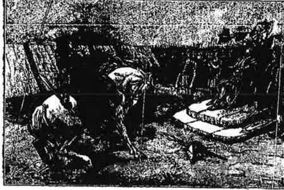
VERCINGÉTORIX JETTE SES ARMES DEVANT CÉSAR.

Vercingétorix a jeté son casque et sa lance. A présent, il jette son épée. Cela voulait dire qu'il se reconnaissait vaincu.