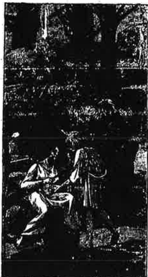
UN GAULOIS ET SON FILS PARTANT POUR LA CHASSE.

Vous voyez, à droite, un Gaulois. Il a les cheveux très longs. Sa moustache est très longue aussi. Il est habillé d'une blouse, d'un pantalon et d'un manteau agrafé sur l'épaule. Le manteau est fait d'une peau de bête.