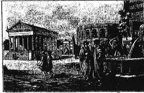
UNE VILLE GAULOISE DU TEMPS DES ROMAINS

5. Une ville gauloise. — Voici une place d'une ville. Vous y voyez de beaux monuments à colonnes. Une fontaine verse son eau nuit et jour. Cette ville