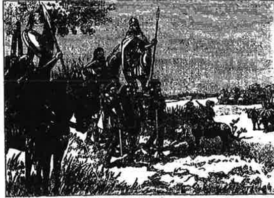
LE ROI CLOVIS SUR LE BOUCLIER.

le casque en tête, une lance à la main. Une épée et un bouclier pendaient à sa ceinture. C'est ainsi que vous le voyez représenté sur l'image. Derrière le bouclier, vous apercevez, à moitié cachée, une hache, qu'on appelait francisque , c'est-à-dire arme des Francs. Les Francs se servaient très bien de la francisque. Ils la lançaient sur les casques de leurs ennemis et leur fondaient la tête.