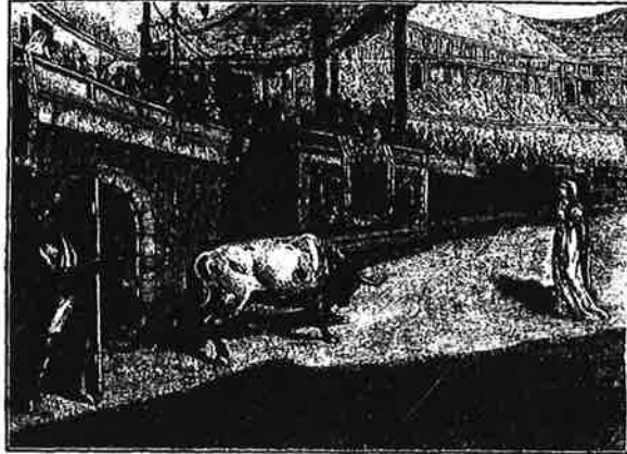
SAINTE BLANDINE VA MOURIR.

Au milieu du cirque, Blandine est debout, liée