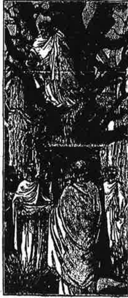
UN DRUIDE CUEILLE LE GUI.

La cérémonie finie, on s'asseyait par terre pour manger, boire et chanter ; souvent, on buvait trop et alors on se disputait et on se battait. Les Gaulois aimaient à se disputer et à se battre, comme font les peuples sauvages.