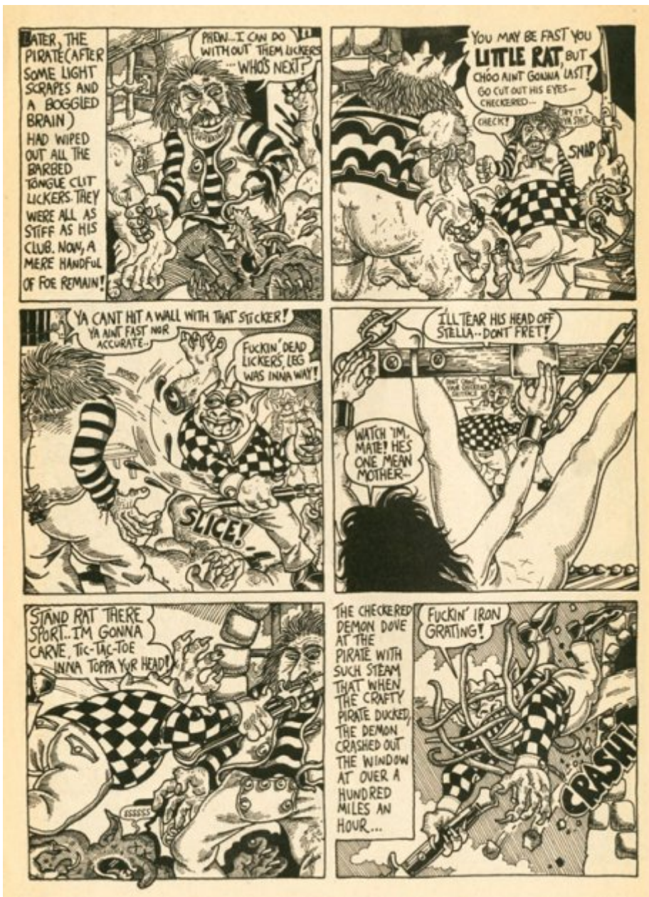
S. Clay Wilson, "Star Eyed Stella" (extrait), 1969, Zap Comix No.4.

Dès ses premiers essais de science-fiction et de récits d'horreur signés Jaxon, Jack Jackson se montre fasciné par un travail sur le réalisme historique. Le court récit « Nits make lice », dans Slow Death No.7 (1976), qui détaille les exactions horribles commises par la cavalerie lors du massacre de Sand Creek, marque la naissance de son projet d'établir la plus juste et précise histoire des nations indiennes. Joseph Witek a montré comment les outrances visuelles du récit, impensables à l'époque ailleurs que dans l'édition « underground », font précisément la force de ces pages. Il n'hésite pas à faire du travail de Jackson le précurseur des œuvres d'Art Spiegelman ou Joe Sacco.