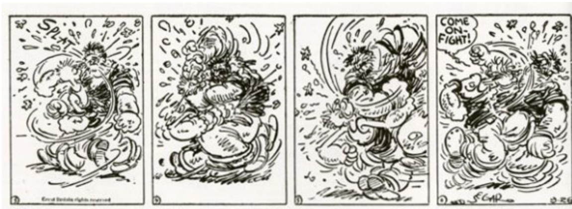
E.C. Segar, Popeye , 26 septembre 1932.

Au fil des ans, la concurrence du cinéma pousse les auteurs de bande dessinée à développer la mise en cases de situations de violence venant en ligne droite des comédies slapstick : la brique de Krazy Kat ou les explosions de pétards de Pim Pam Poum commencent à rythmer les séquences des comic strips et bientôt les Pieds Nickelés ne sont plus en reste de bagarres échevelées. Des auteurs trouvent diverses solutions à des problématiques comme la traduction de la vitesse ou de la force. Un des plus inventifs est E.C. Segar dans sa série Thimble Theatre (créée en 1919) où s'impose le personnage de Popeye le marin bagarreux, introduit presque par hasard le 17 janvier 1929. Le long combat qui oppose Popeye et Bluto en septembre 1932 s'étale sur 11 strips quotidiens dans lesquelles les lignes de vitesse finissent par brouiller totalement l'image, traduisant parfaitement la frénésie de mouvements des lutteurs. Mentionnons aussi ce strip du 3 février 1930 où Segar poursuit un même décor sur plusieurs cases que traverse Popeye,