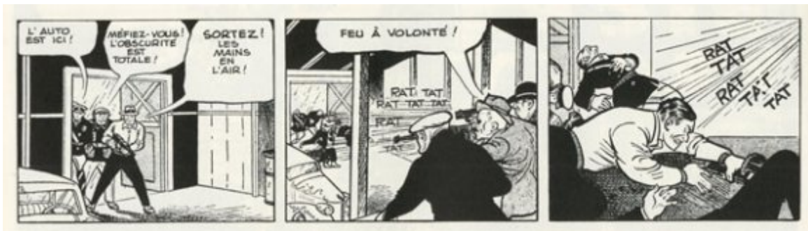
Chester Gould, Dick Tracy, 25 mars 1939.

Le début de Dick Tracy en 1931 est un jalon essentiel parce qu'il s'agit de la toute première bande dessinée policière mais aussi parce qu'une violence que l'on pourrait pour la première fois qualifier de sociétale est au cœur du projet. Il s'agit pour l'auteur (Chester Gould) et le responsable éditorial qui le soutient totalement et l'encourage (Joseph Meddill Patterson, alias « The Captain ») de proposer au sein du supplément dominical du Chicago Tribune une série en prise directe avec la folle actualité du crime de l'époque (Dillinger, Capone et autres légendes de la prohibition) et d'opposer à la violence des truands la violence de la justice ! Le succès est immédiat, d'autant que le propos est relayé par une violence graphique encore efficace aujourd'hui. Les scénarios tortueux et l'imagination enflammée de Gould sont soutenus par la virtuosité de nouveaux codes graphiques dans le découpage de l'action et par un trait jouant sur la caricature et le grotesque, dans un noir et blanc sans nuances. Les corps des personnages, bons ou mauvais, sont hachés par les rafales de mitrailleuses, des dispositifs démoniaques de mises à mort retardée se succèdent au fil des jours. Patterson prend toutefois soin d'équilibrer son offre dominicale ou journalière avec d'autres séries plus consensuelles. L'arrivée consécutive d'autres séries policières banalisera les coups de feu et les mitraillades mais Dick Tracy restera l'exception pour de nombreuses années.